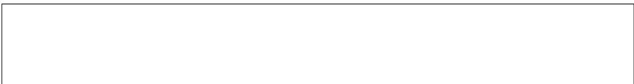
< [그림-8] 벤처투자 종합정보시스템 웹서버에 SSL을 적용하지 않은 화면 >

① 「개인정보 보호법」 하위 규칙인 「개인정보의 안전성 확보조치 기준」 제7조(개인정보의 암호화) 제1항에 따르면 개인정보처리자는 고유식별정보, 비밀번호 , 생체인식정보를 정보통신망을 통하여 송신하는 경우 이를 암호화 하여야 한다. 벤처투자 종합정보시스템은 [그림-8]과 같이 로그인 화면에서 비밀번호를 입력 후 정보통신망을 통하여 정보를 송신하는 과정에서 암호화를 하지 않고 있다.