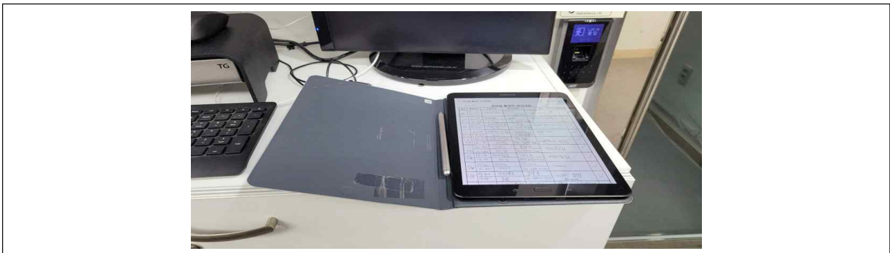
< [그림-21] 주전산기실(통제구역) 테블릿PC >

정보기기의 반.출입을 엄격히 통제하고 있으나, [그림-21]와 같이 유지관리(보수) 계약관계에 있는 '(주)AAA'의 상주 인력들의 정보기기가 적절한 인가 절차 없이 반입된 사실이 있음을 확인했다.